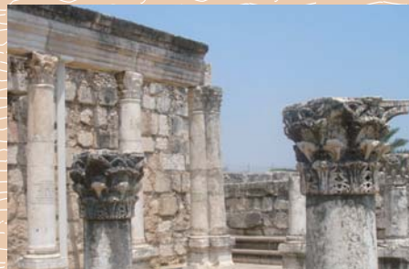
カペナウム