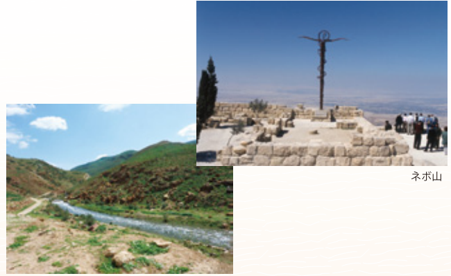
ベヌエルとヤボク川

*上記日程は2012年4月20日現在のスケジュールに基づいて作成しております。 現地の事情によりスケジュールが変更となる場合もございますので、予めご了承ください。 *観光は英語ガイドがご案内します。