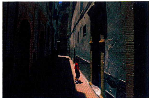
モロッコの街中(カサブランカ・エッサウィラ/イメージ)